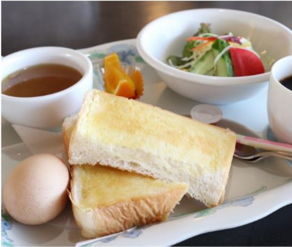
モーニングセット 950円