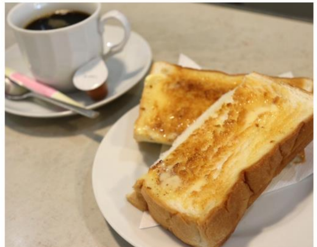
トーストセット 590円