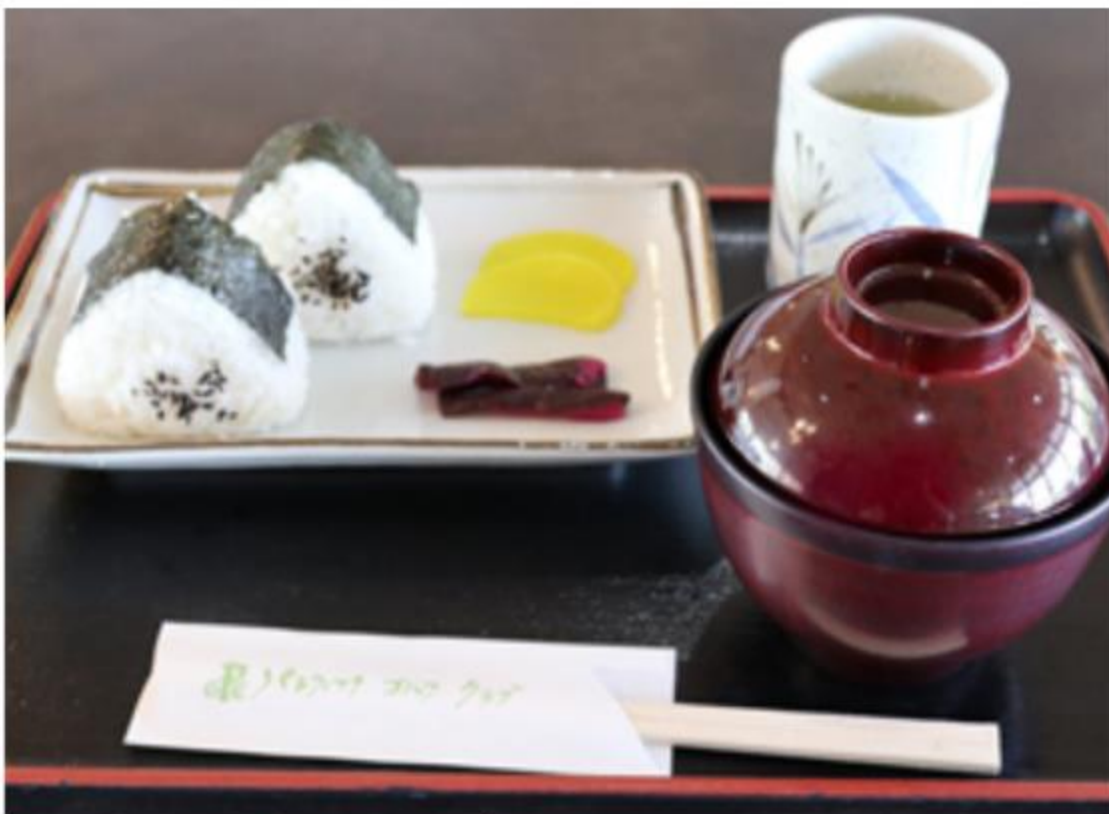
おにぎりセット 700円