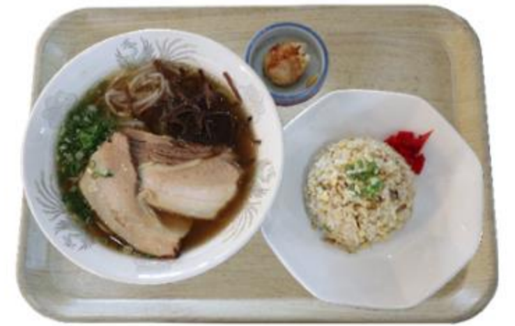
チャーシューメンセット 1,770円