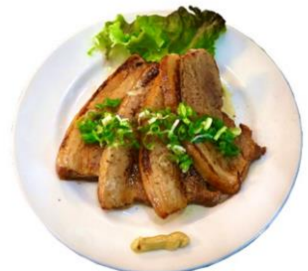
炙りチャーシュー 1,100円