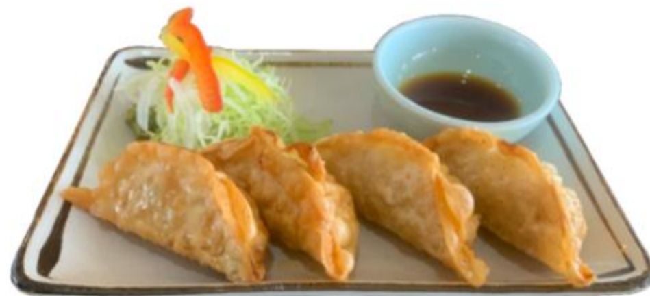
宇都宮揚げギョウザ 700円