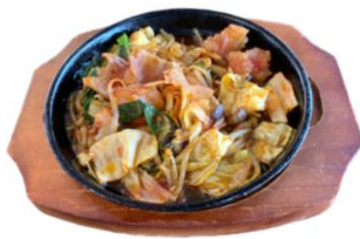
ピリ辛ホルモン炒め 1,350円