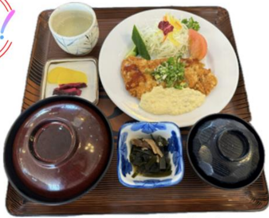
チキン南蛮定食 1,500円