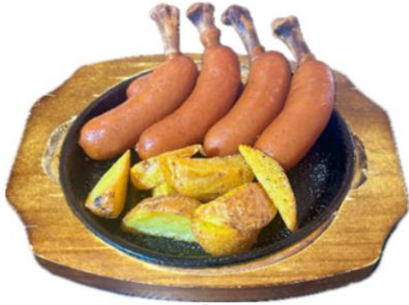
ソーセージとポテト盛り合わせ 1,520円