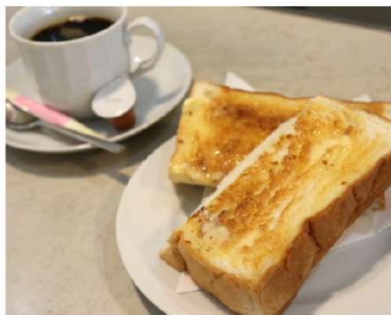
トーストセット 600円