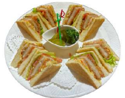
カツサンド 1,600円 (カツサンドハーフ 1,000円)