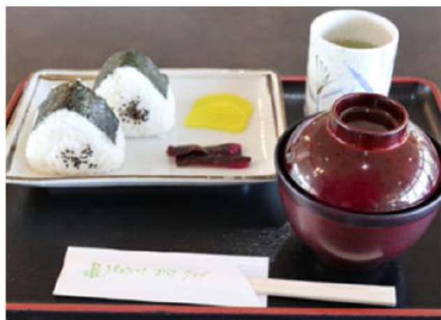
おにぎりセット 750円