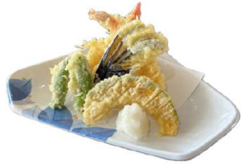
天ぷら盛り合わせ 1,250円