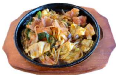
ピリ辛ホルモン炒め 1,450円