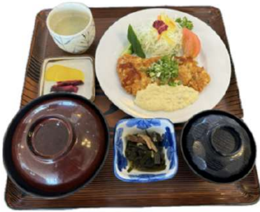
チキン南蛮定食 1,700円