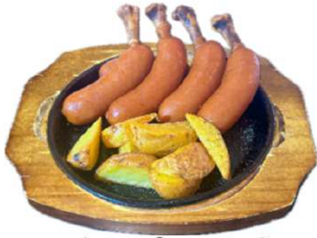
ソーセージとポテト盛り合わせ 1,500円