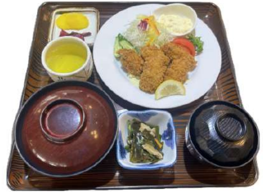
カキフライ定食 1,800円