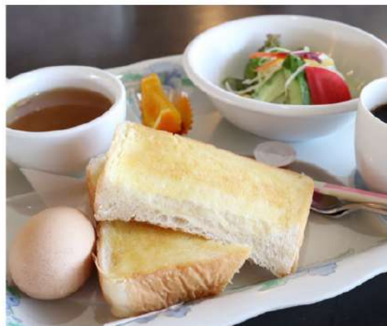
モーニングセット 950円