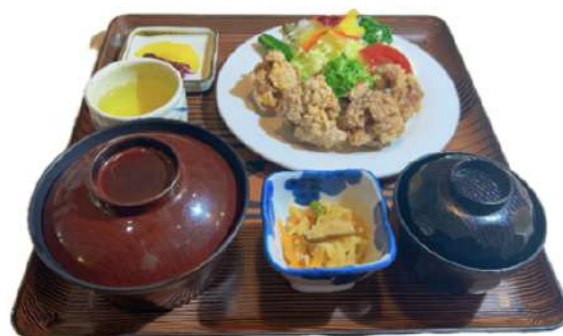
若鶏からあげ定食 1,780円