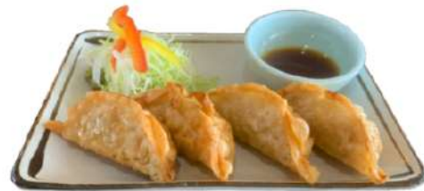
宇都宮揚げギョウザ 750円