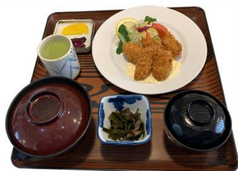
カキフライ定食 1,380円