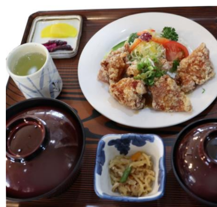
若鶏からあげ定食 1,380円