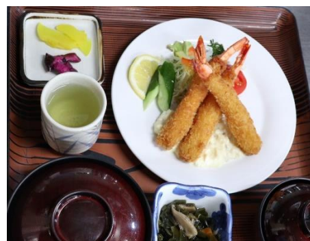
エビフライ定食 1,490円