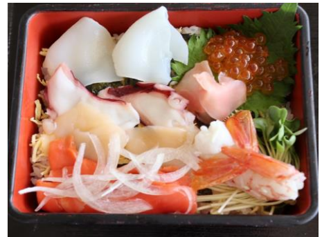
海 鮮 重