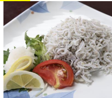
釜揚げちりめん 810円

*クジラのタタキ 1,380円 *メヒカリの唐揚 1,210円 *ウツボの唐揚 860円 *キビナゴの唐揚 590円