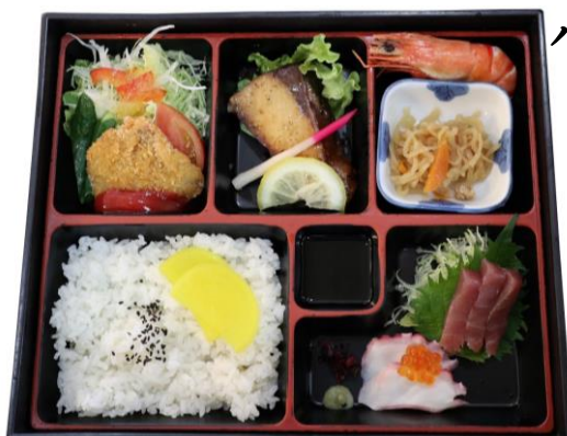
パシフィック弁当 1,490円