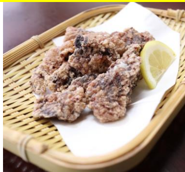
クジラの竜田揚 860円