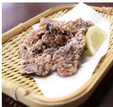
クジラの竜田揚 780円