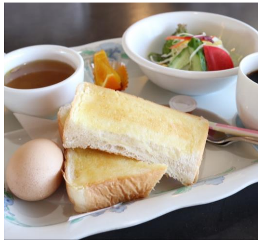
モーニングセット 620円