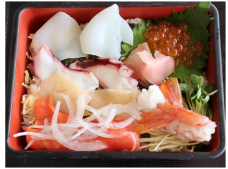
海 鮮 重 1,240円