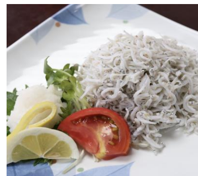
釜揚げちりめん 730円