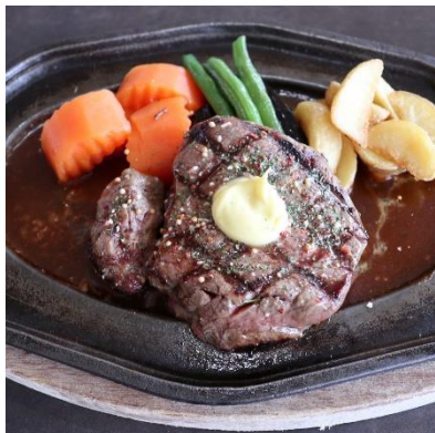
240g 牛ヒレステーキランチ 2,790円