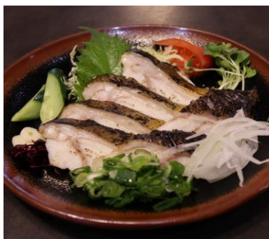
ウツボのタタキ 1,250円